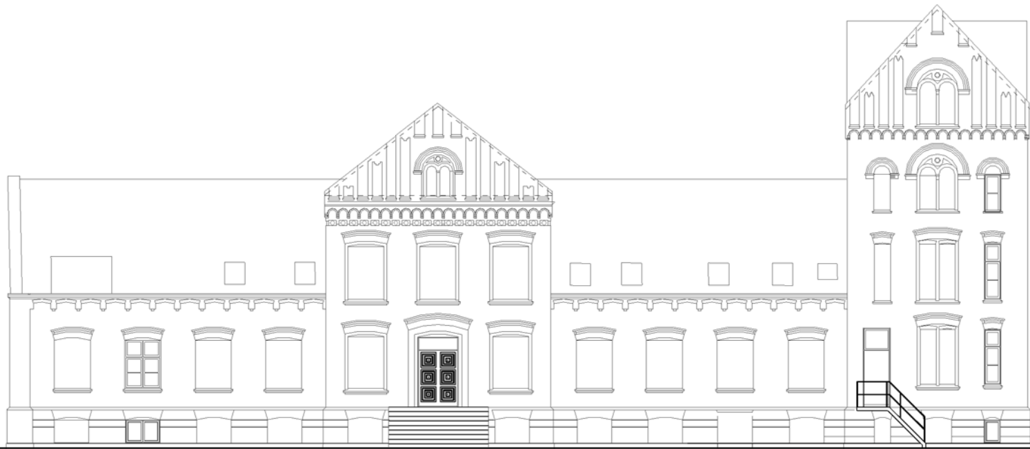
Eksempel på eks. vinduer i facaden