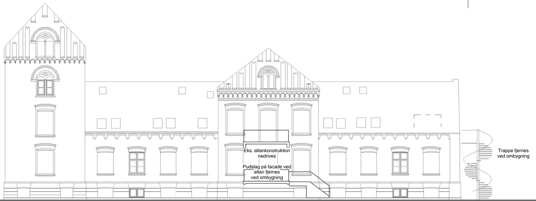
Eksempel på eks. vinduer i facaden